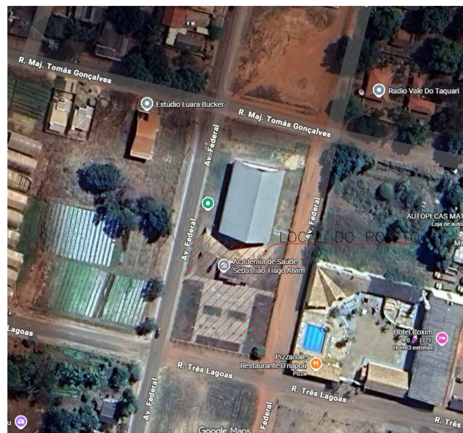
LOCALIZAÇÃO ESC. 1/500